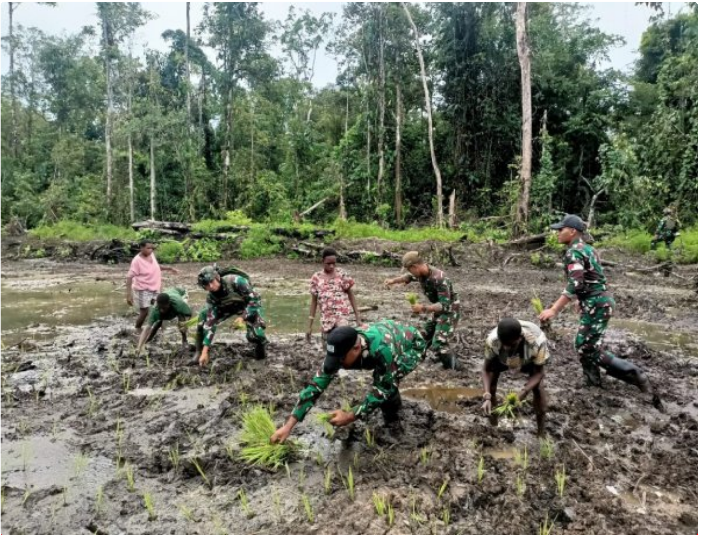
Foto: Satgas Pamtas Mobile RI-PNG Yonif 503/Mayangkara menggalakan program ketahanan pangan yang melibatkan langsung warga Kampung Mumugu, Distrik Krepkuri, Kabupaten Nduga, Selasa (07/01/2025).