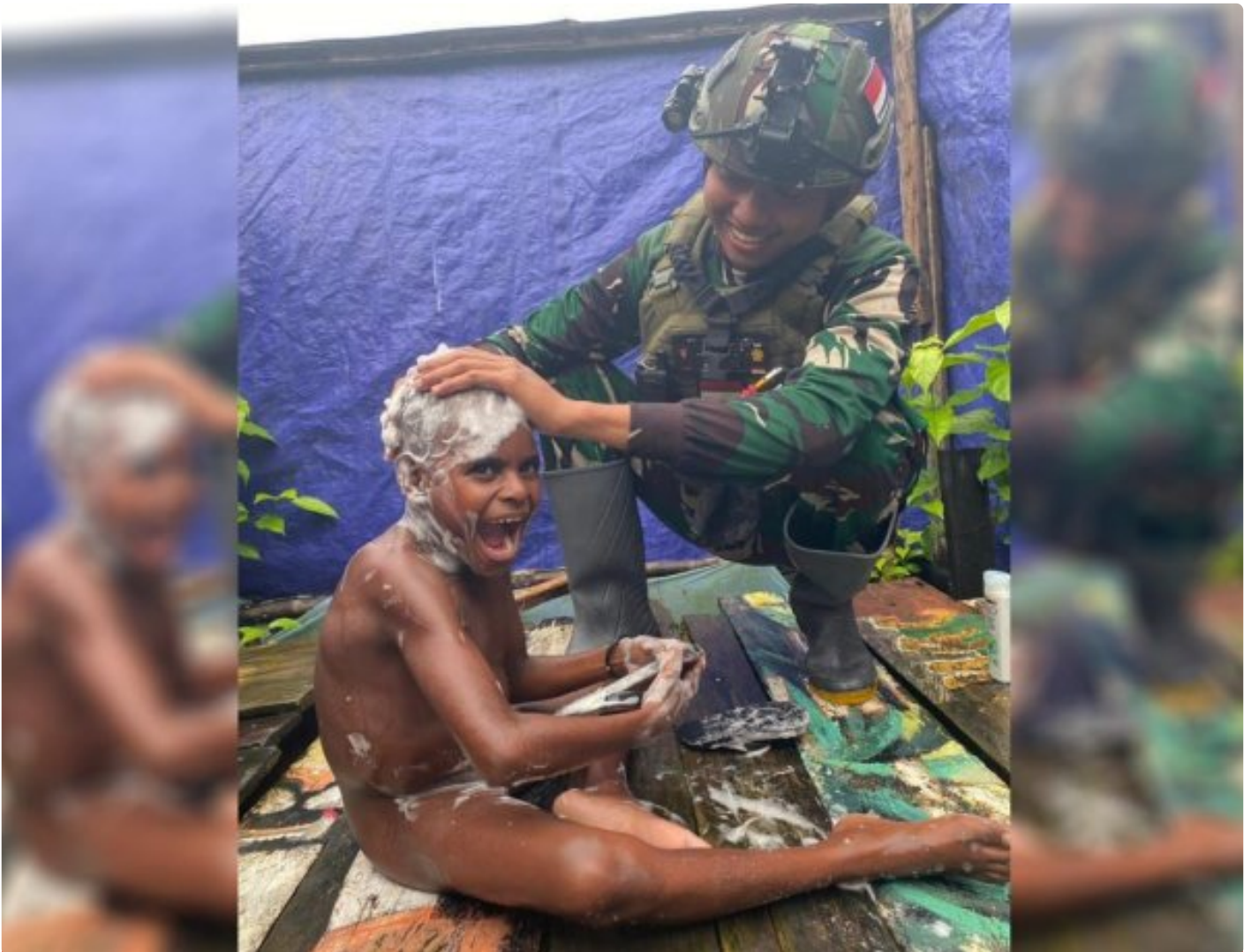
Foto: Saat Satgas Pamtas Mobile RI-PNG Yonif 503/Mayangkara Koops Habema Mengajarkan Anak-anak Menjaga Kebersihan Dengan Mandi Air Bersih di Pos Batas Batu, Kecamatan Batas Batu, Kabupaten Nduga, Papua Pegunungan, Kamis (04/07/2024).

NDUGA- Satgas Pamtas Mobile RI-PNG Yonif 503/Mayangkara Koops Habema